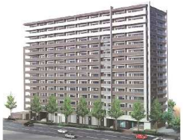
※イメージパースです。