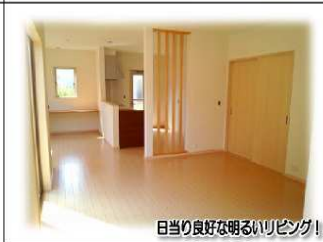
日当たり良好な明るいリビング!