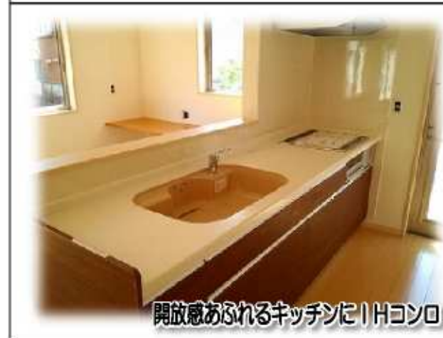
開放感あふれるキッチンにIHコンロ!