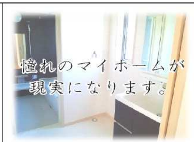
憧れのマイホームが 現実になります。