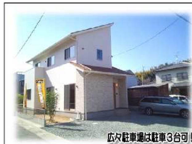
広々駐車場は駐車3台可!