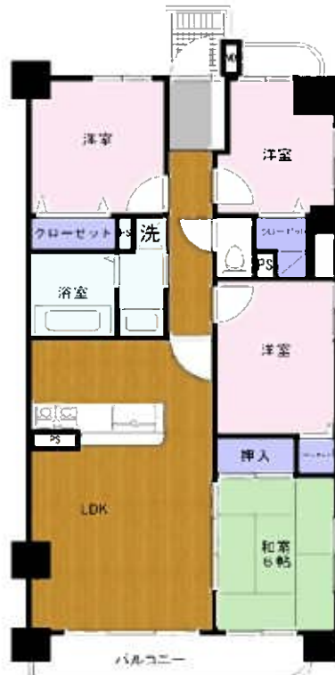
※間取りは略図につき現況優先です