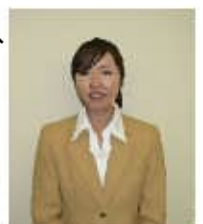
担当：田上(たのうえ)

繁华街にも歩いて行ける立地ながら、静かな住環境のマンションです。徒歩圏内にスーパー、医院等あり、住環境も充実。 今週内装リフォームが完了しました。 ペットも飼えますよ(´▽`) また、バルコニーからは熊本城が望めます。 高層階ならではの眺望を是非！ ご来場お待ち申し上げます！